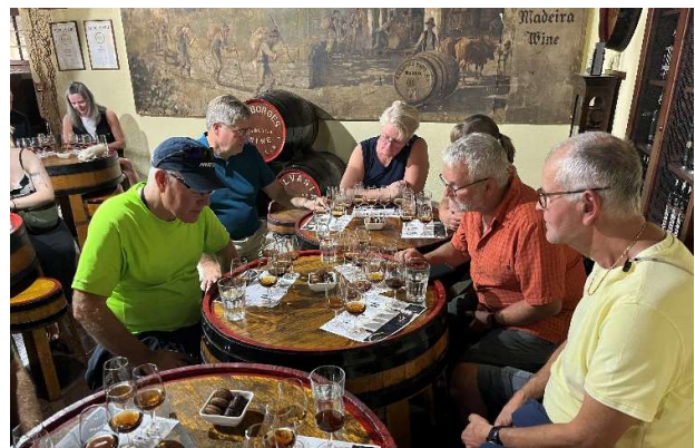
Vinprovning Madeiraviner på H M Borges