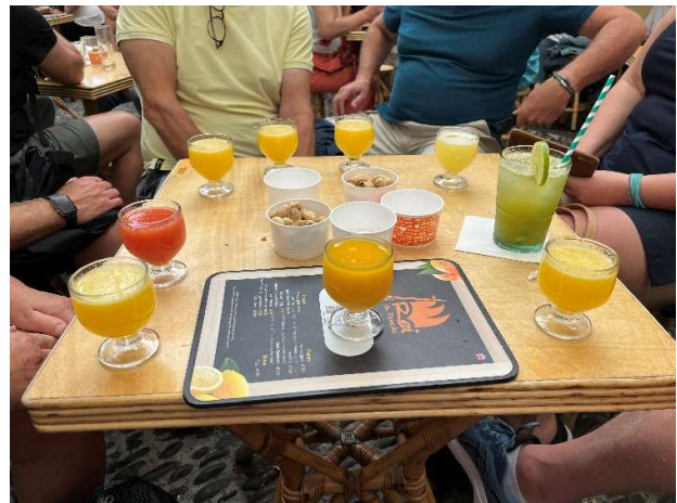
Provsamling av den lokala Poncha

Klart för avsegling till Madeira vid tiotiden. Solsken och lätta vindar ger en angenäm segling på cirka 35 sjömil. Branta klippor reser sig vid udden när vi närmar oss Madeira. Vi har fått plats i Marina da Quinta Grande. Det är en liten trevlig marina vid madeiras östra udde. Platsen domineras av turism med ett stort hotell och spaanläggning som inte släpper in personer som inte bor där. Det får bli en öl i restaurangen vid marinan där vi också äter kvällsmat. Därefter trevlig samvaro i båten med ett glas vin.