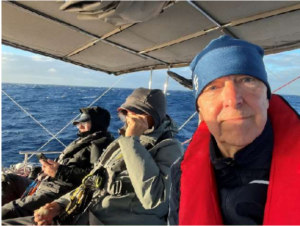
Vaktpass på "fly bridge"