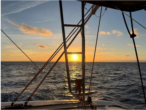
Soluppgång i bra väder

När vi går på förmiddagsvakten klockan åtta håller solen på att gå upp och det är lätta vindar. Successivt blir det mera mulet med några skurar. Vid elvtiden mulnade det helt igen och regnet blir mer ihållande. Det är ett tätt blött regn som tränger in överallt, vinden ökar från sju meter till över tio meter per sekund. Efter passet är det skönt vad sträcka ut på kojn med torra kläder och skriva några rader i takt med gungandet. Vi seglar med två rev i storen och något inrullad fock. Fortsatt kraftig vind och det rullar hela tiden med översköljningar. Vinden håller stadigt 12 till 14 meter per sekund med stora långa vågor med kraft. Inför kvällspasset gäller det att få på sig långkalsonger och tröjor. Vi möter en större båt som vi identifierar med hjälp utav lanternorna, men den har ingen AIS. Vi får lova upp 15 grader för att undvika att komma alltför nära